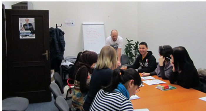
Nížkoprahový kurz slovenčiny