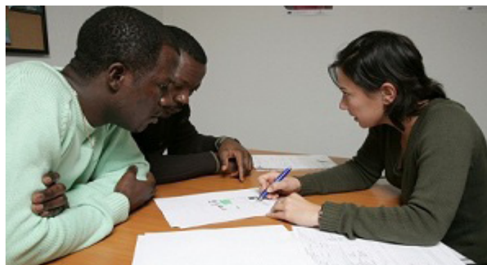
Poradenstvo v MIC

Skúsenosti z poradenskej praxe MIC využíva ako podklad na aktivity zamerané na budovanie kapacít relevantných aktérov štátnej správy (školenia v oblasti interkulturality) a na pozitívne ovplyvňovanie integračných politík SR. Viac informácií nájdete na webovej stránke MIC mic.iom.sk .