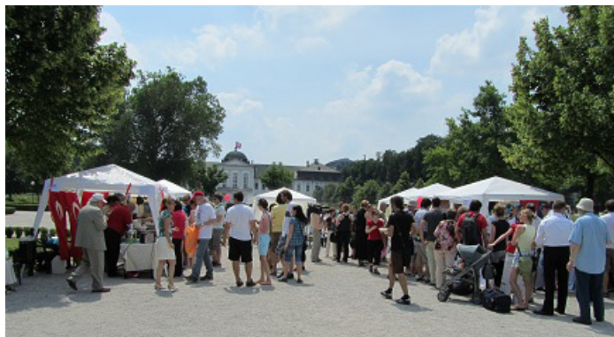
Gastrofestival komunít migrantov v SR