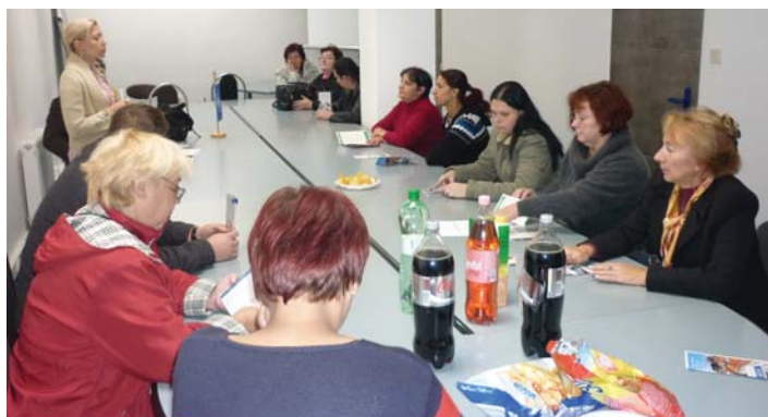
Sme tu pre vás