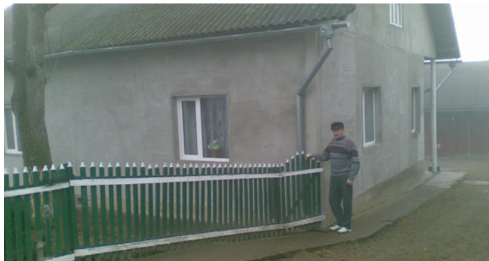
Dom ukrajinskej rodiny v obci Velesniv pred rekonštrukciou a po zateplení a výmene okien.

Klient svojpomocne vykonal všetky rekonštrukčné a izolačné práce. Opravy výrazne znížili energetickú náročnosť domu a náklady na vykurovanie. Úspešná reintegračná pomoc sa stala pozitívnym príkladom aj pre ostatných migrantov vracajúcich sa zo Slovenska na Ukrajinu. Výsledok sa prejavil vo zvýšenom záujme návratilcov o podporu a počte úspešných implementácií reintegračnej pomoci v tejto oblasti.