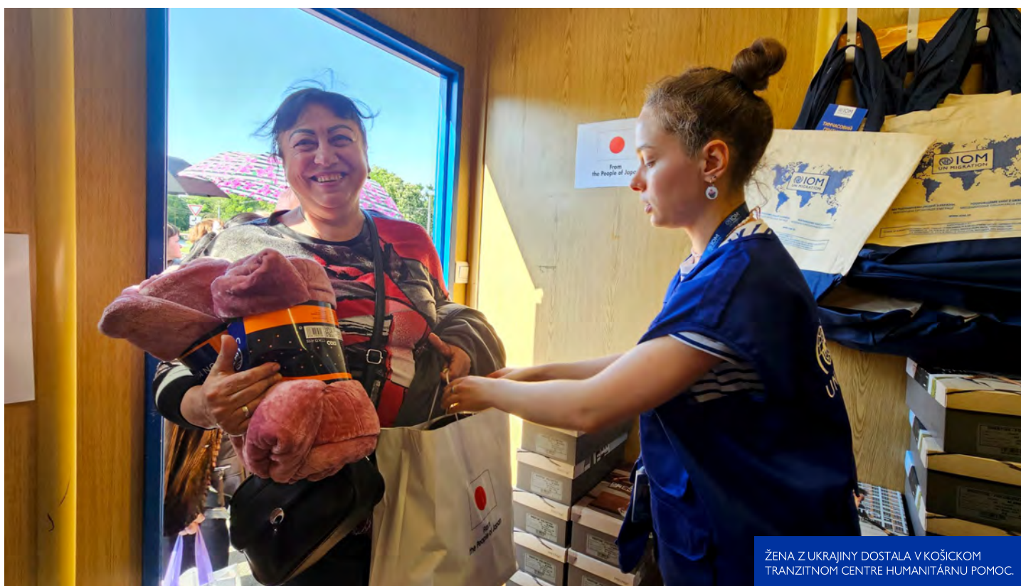
ŽENA Z UKRAJINY DOSTALA V KOŠICKOM TRANZITNOM CENTRE HUMANITÁRNU POMOC.